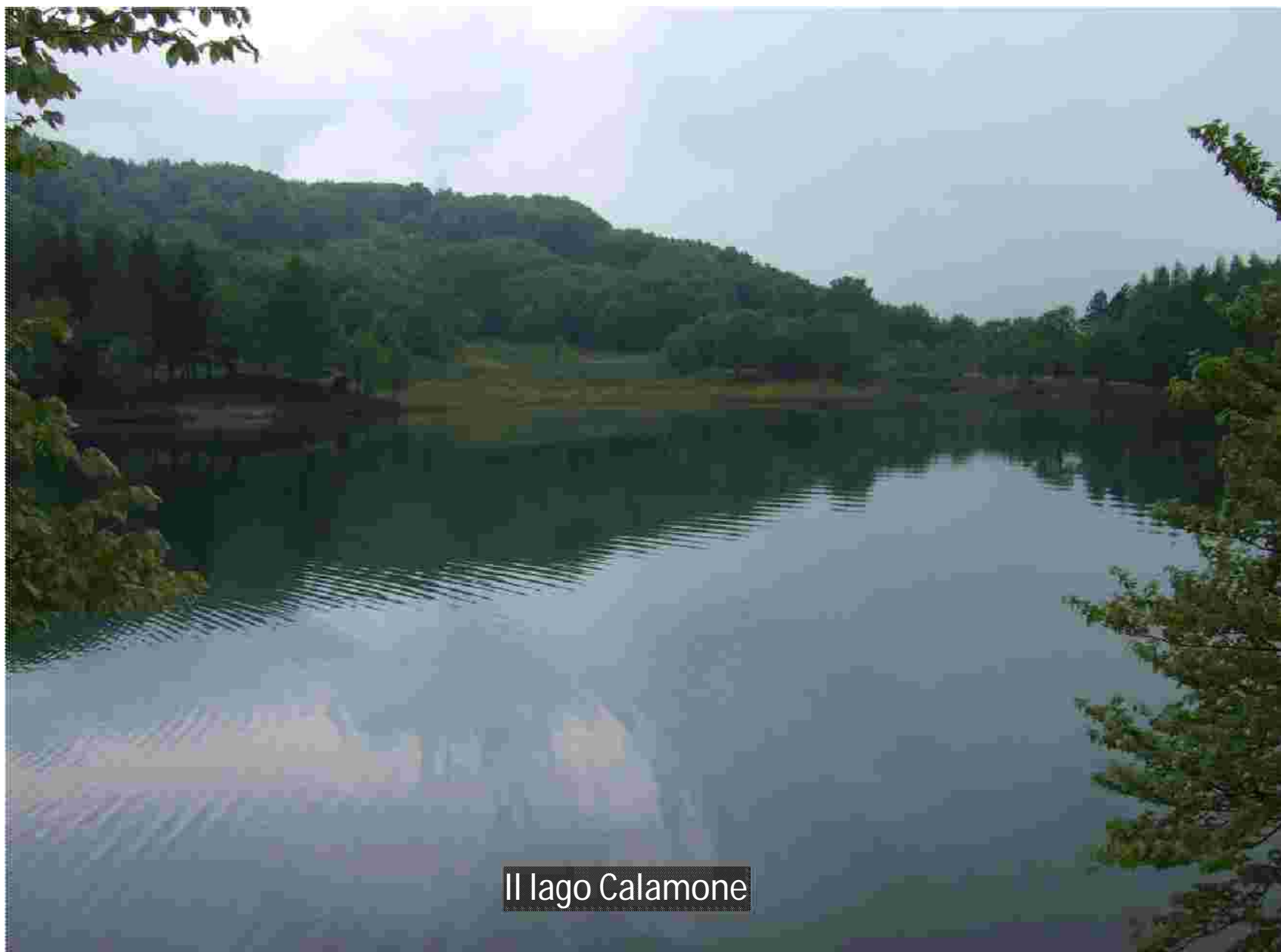
Il lago Calamone