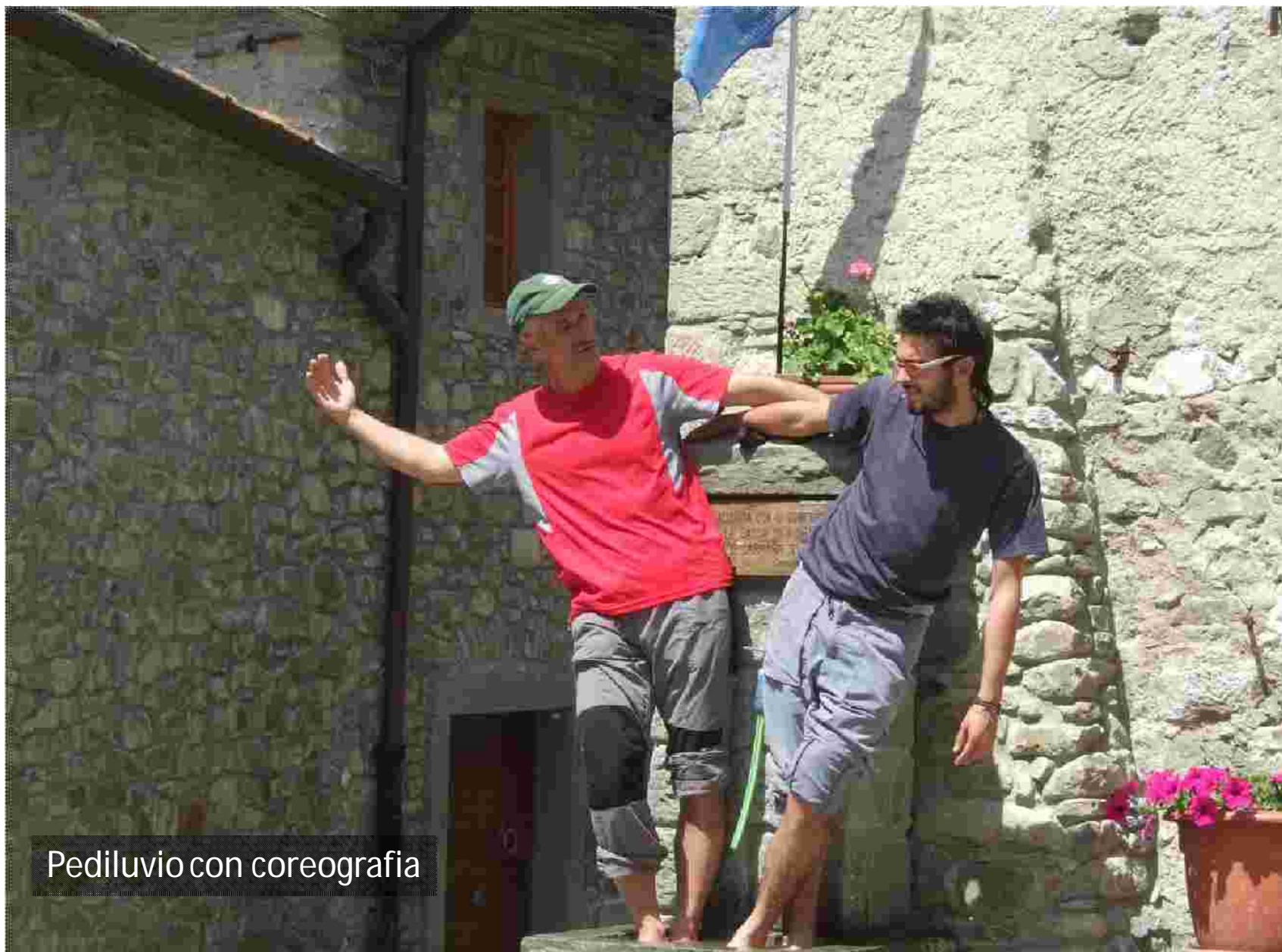
Pediluvio con coreografia