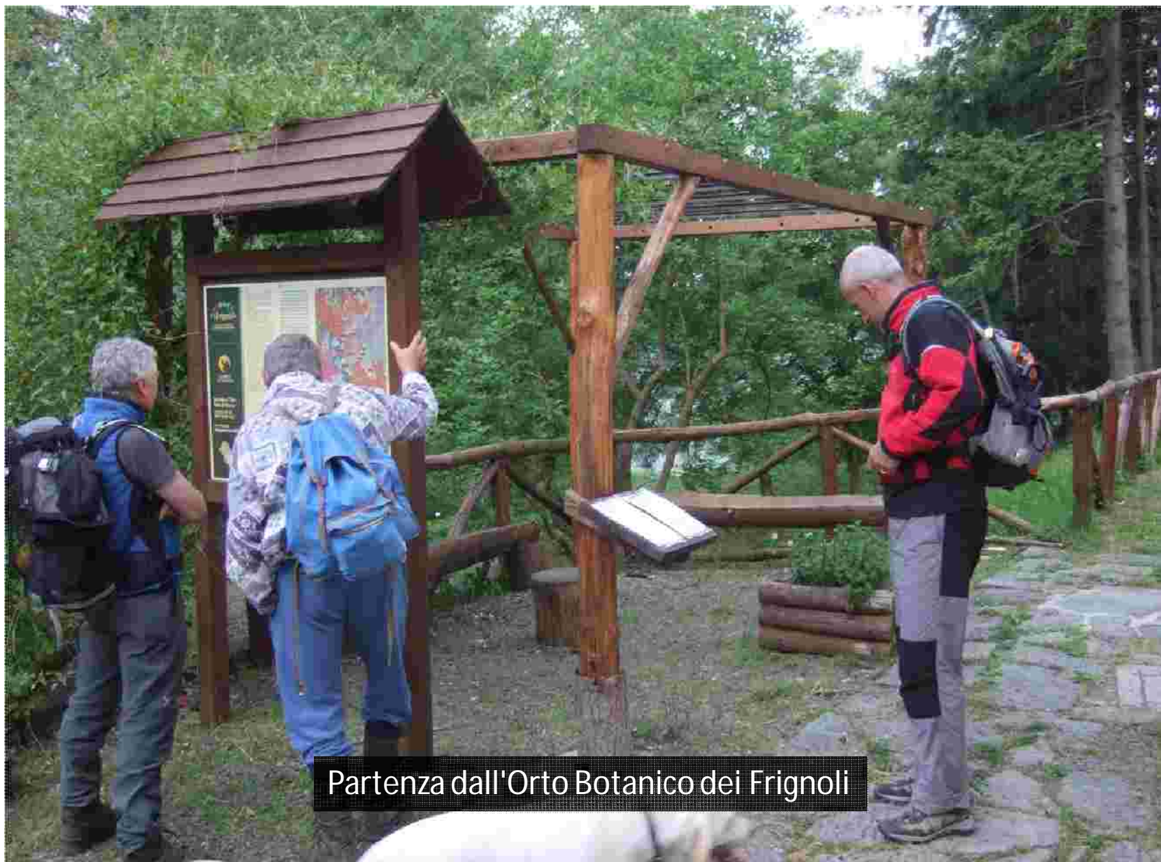
Partenza dall'Orto Botanico dei Frignoli