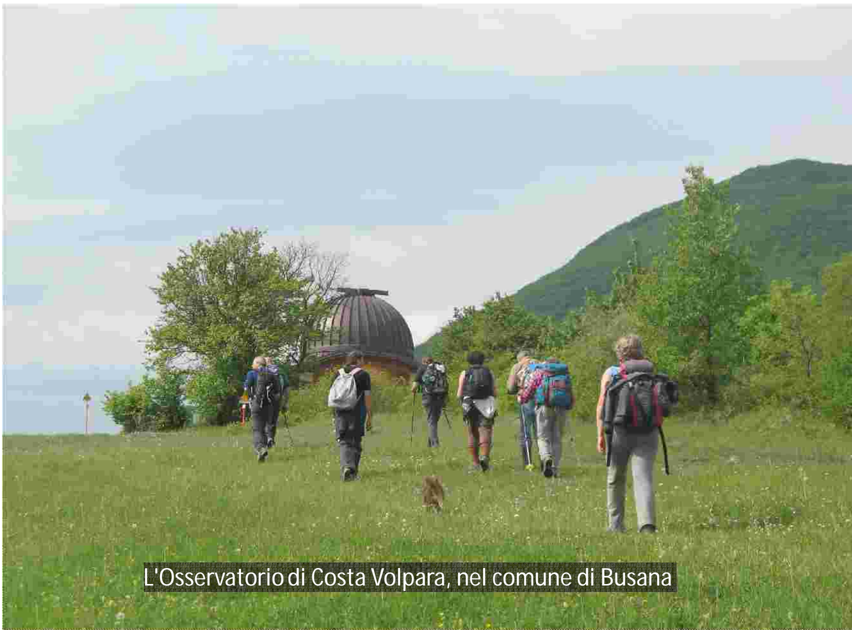
L'Osservatorio di Costa Volpara, nel comune di Busana