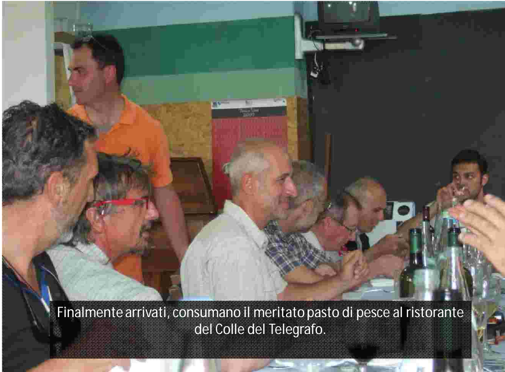
Finalmente arrivati, consumano il meritato pasto di pesce al ristorante del Colle del Telegrafo.